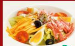
イタリア風サラダ