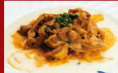
国産牛バラ肉の ストロガノフ風