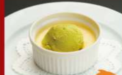
ババロアとアイス